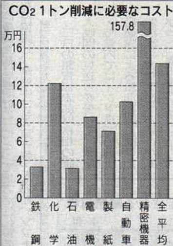
主要業種の議定書期間中の年平均排出量